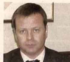
Mejor Abogado Propiedad Intelectual Alfredo Montaner SARGENT & KRAHN